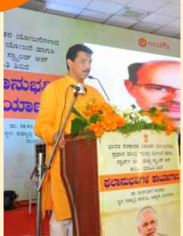
Mr. Arjun Ram Meghwal, Union Minister of State in Finance and Corporate Affairs Inaugurated the workshop