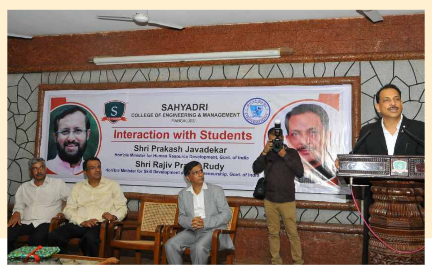
A word of motivation and encouragement to First Year Engineering Students