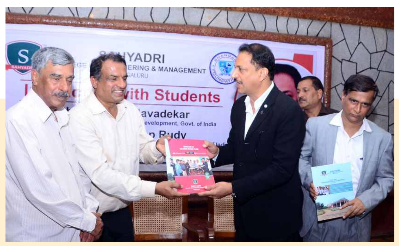
Book Release - "First Year Engineering Students Achievements"