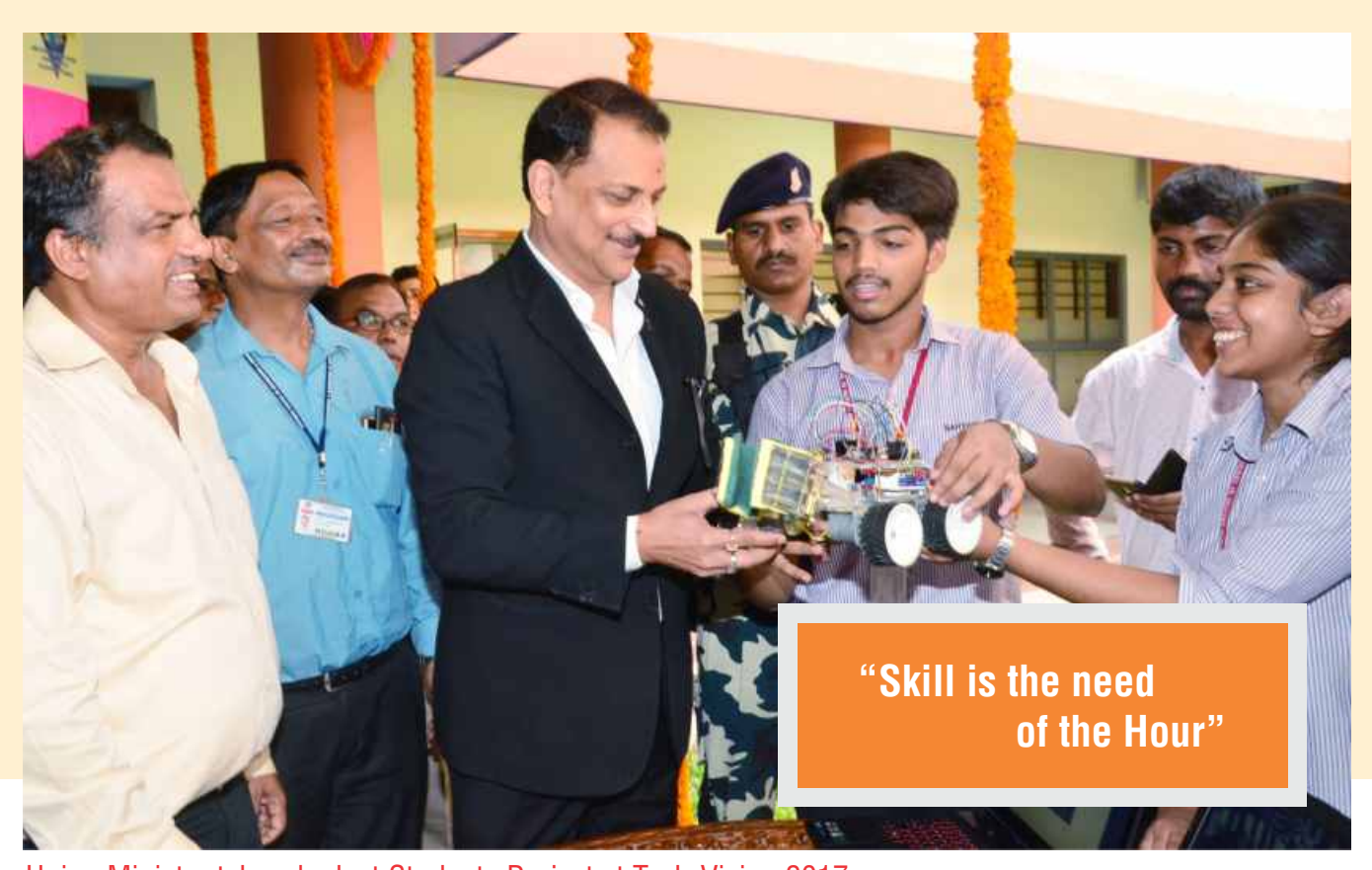
Union Minister take a look at Students Project at Tech-Vision 2017