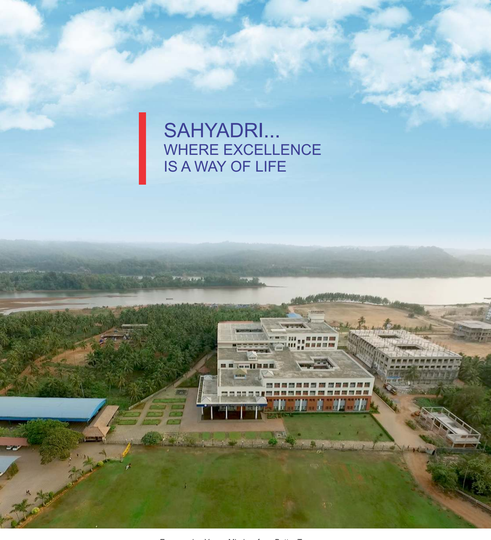
Empowering Young Minds... for a Better Tomorrow