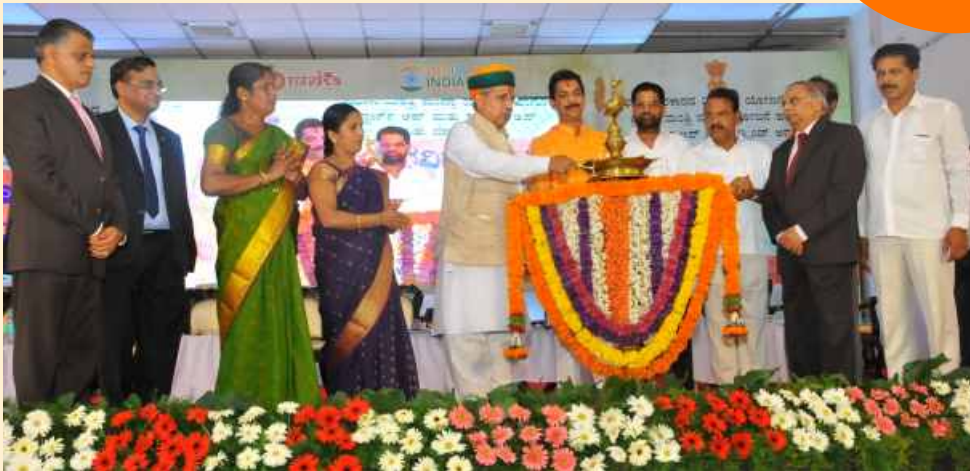
Mr. Arjun Ram Meghwal, Union Minister of State in Finance and Corporate Affairs Inaugurated the workshop