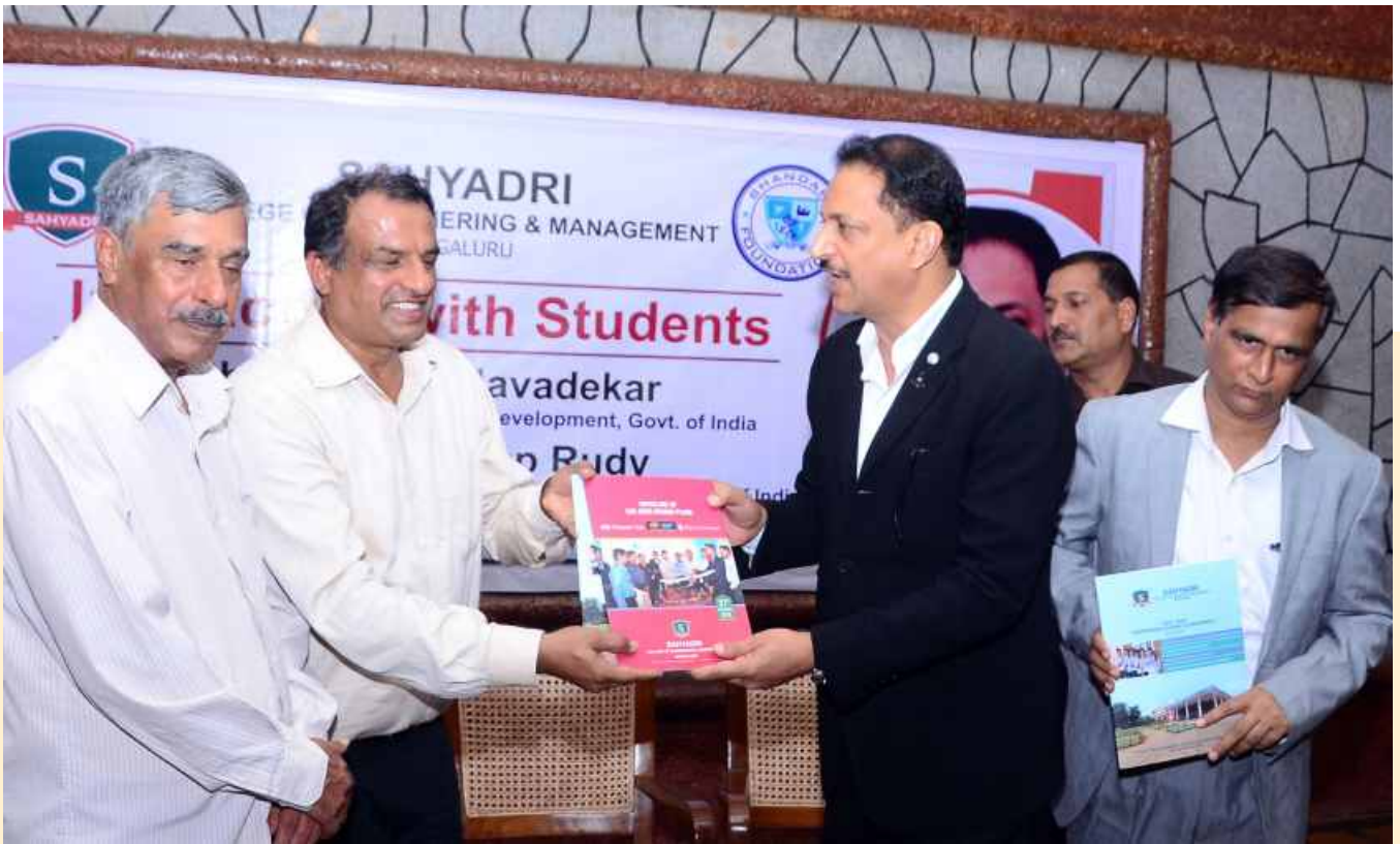
Book Release - "First Year Engineering Students Achievements"