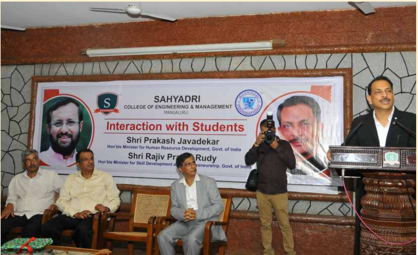
A word of motivation and encouragement to First Year Engineering Students