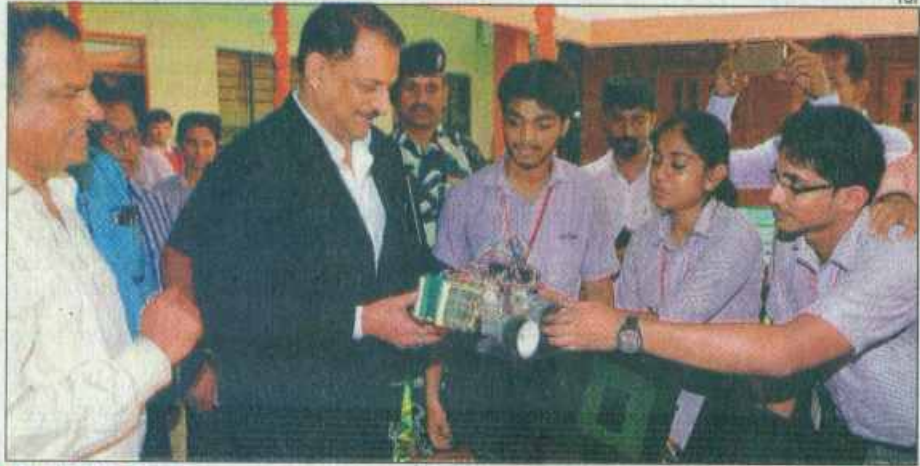
EXTENDING SCOPE: Rajiv Pratap Rudy, Union minister for skill development and entrepreneurship, interacts with students at Sahyadri College of Engineering and Management, in Mangaluru on Thursday

tech garage and start-ups@sahyadri at Sahyadri College of Engineering and Management on Thursday, Rudy said the equivalence will put students who join ITIs in India after dropping out from 10th or 12th standard on par with their counterparts who pass out either from CBSE or ICSE. "This will effect 2.3 million students who join ITIs and we have created a pathway for them to become graduate engineers with one year of diploma," he said.