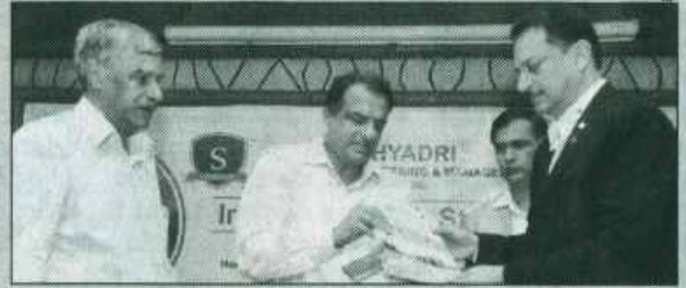
ರಾಜೀವ್ ಪ್ರತಾಪ್ ರೂಡಿ ಮಾಹಿತಿ ಪತ್ರ ಅನಾವರಣಗೊಳಿಸುತ್ತಿರುವುದು.