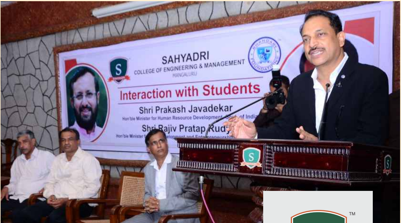
Interaction with First Year Engineering Students

While addressing Sahyadrians, Mr. Rajiv Pratap Rudy extended his deepest condolence to the Union Minister of State for Environment, Forest and Climate Change, Mr. Anil Madhav Dave who passed away this morning. He then informed the gathering of his urgency to leave and quickly appreciated the B.E students who brought laurels to Sahyadri by participating in competitions at IITs/NITs and also took pride in congratulating them by saying that these students are much better than them as they won places in top engineering institutions of the country. He then inaugurated “Tech Vision 2017”, an intra-collegiate project competition and congratulated the participants for their extraordinary projects displayed and presented during the site tour. He also released a book on “First Year Engineering Students Achievements” which talks about the success stories of the student's participation at IITs and NITs.