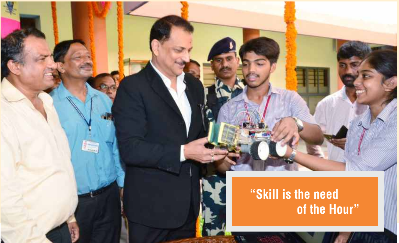
Union Minister take a look at Students Project at Tech-Vision 2017