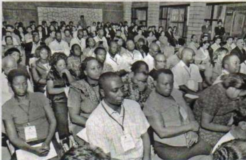
Foreign delegates at the international conference on agribusiness management in Mangalore on Thursday.