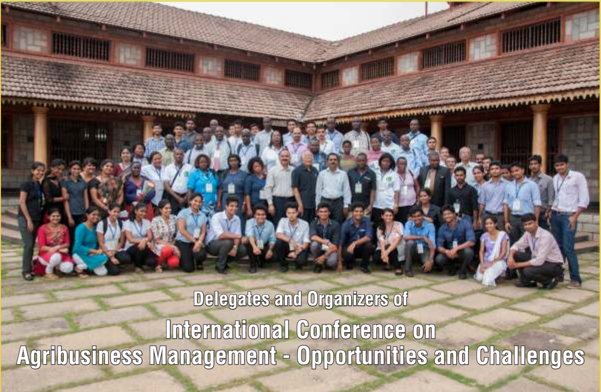
Delegates and Organizers of International Conference on Agribusiness Management - Opportunities and Challenges

Accreditation from the IAO (International Accreditation Organisation) The institution is awarded with ISO 9001-2008 certificate, from TUV Nord, Germany