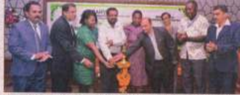
ಅಂತಾರಾಷ್ಟ್ರೀಯ ಸಮ್ಮೇಳನದ ಉದ್ಘಾಟನೆ ನಡೆಯಿತು.

ಕೃಷಿ ಸಮ್ಮೇಳನ ಕೃಷಿ - ಅಭಿವೃದ್ಧಿ ಉದ್ದೇಶವನ್ನು ರಾಜ್ಯ ಅಭಿವೃದ್ಧಿ ಇಲಾಖೆಯು ಉದ್ಘಾಟಿಸುತ್ತಿರುವ ಮೊದಲ ಮೌಲ್ಯವರ್ಧನೆಯ ಕೃಷಿ ಸಮ್ಮೇಳನದ ಉದ್ಘಾಟನೆ ಈಗಾಗಲೇ ನಡೆಯಿತು. ಅಂತಾರಾಷ್ಟ್ರೀಯ ಸಮ್ಮೇಳನದ ಉದ್ಘಾಟನೆ ನಡೆಯಿತು. ಅಂತಾರಾಷ್ಟ್ರೀಯ ಸಮ್ಮೇಳನದ ಉದ್ಘಾಟನೆ ನಡೆಯಿತು. ಅಂತಾರಾಷ್ಟ್ರೀಯ ಸಮ್ಮೇಳನದ ಉದ್ಘಾಟನೆ ನಡೆಯಿತು.