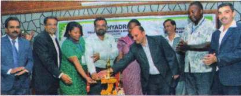
ಮಂಗಳೂರು: ಸಹ್ಯಾದ್ರಿ ತಿಕ್ಷಣ ಸಂಸ್ಥೆಯಲ್ಲಿ ಅಂತಾರಾಷ್ಟ್ರೀಯ ಸಮ್ಮೇಳನ ಉದ್ಘಾಟನೆಗೊಂಡಿತು.