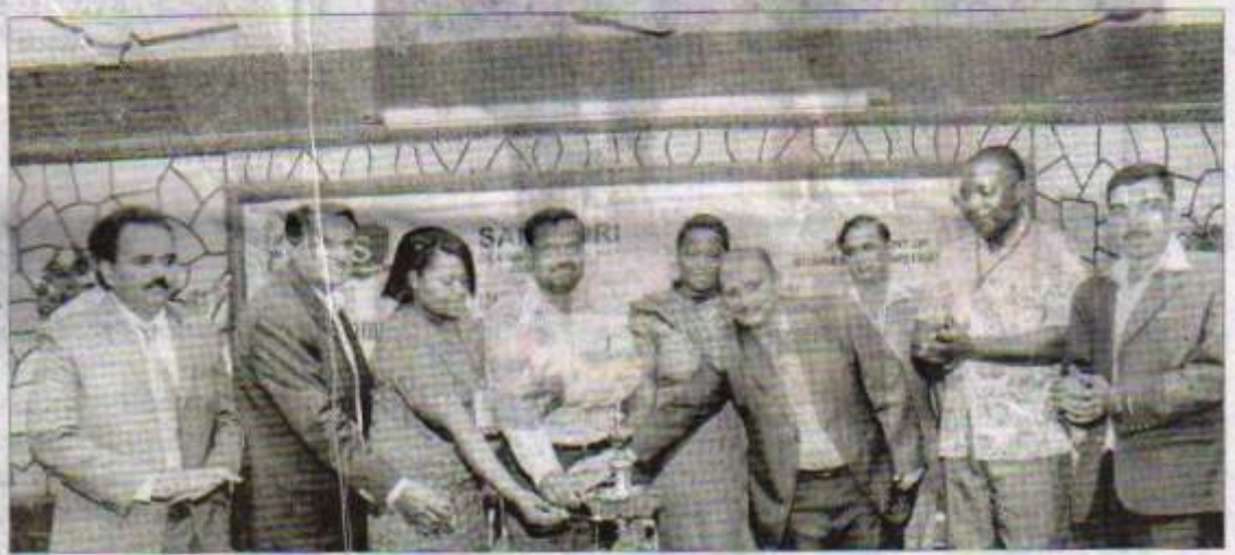
ಮಂಗಳೂರಿನಲ್ಲಿ ಸಹ್ಯಾದ್ರಿ ಕಾಲೇಜ್ ಆಫ್ ಎಂಜಿನಿಯರಿಂಗ್ ಆಂಡ್ ಮ್ಯಾನೇಜ್‌ಮೆಂಟ್‌ನಿಂದ 'ವ್ಯವಸಾಯೋದ್ಯಮ ನಿರ್ವಹಣೆ: ಅವಕಾಶಗಳು ಮತ್ತು ಸವಾಲುಗಳು' ವಿಷಯದ ಕುರಿತು ಅಂತಾರಾಷ್ಟ್ರೀಯ ಸಮ್ಮೇಳನ ಗುರುವಾರ ಉದ್ಘಾಟನೆಗೊಂಡಿತು.