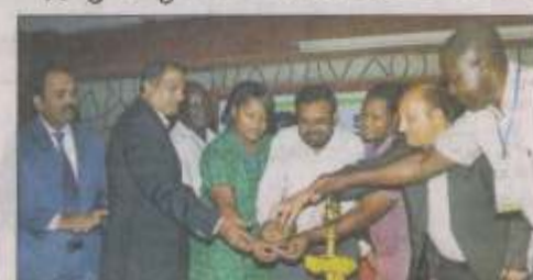
ಅಂತಾರಾಷ್ಟ್ರೀಯ ಸಮ್ಮೇಳನದ ಉದ್ಘಾಟನೆ ನಡೆಯಿತು.

ಮಂಗಳೂರು: ರೇತಲಲ್ಲಿ ಜನಸಮೃದ್ಧಿಯ ಒಂಕೆಗೆ ಅಮೆರಿಕದವರಿಗೆ ಅಪಾರ ಉದ್ದೇಶವನ್ನು ಧ್ಯಾನಿಸಿ ಕೃಷಿ ವ್ಯವಹಾರವಾಗಿ ಪರಿವರ್ತಿಸಲಾಗಿದೆ. ಕೃಷಿ ವ್ಯವಹಾರವಾಗಿ ಪರಿವರ್ತಿಸಲಾಗಿದೆ. ಕೃಷಿ ವ್ಯವಹಾರವಾಗಿ ಪರಿವರ್ತಿಸಲಾಗಿದೆ.