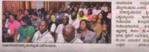
ಅಂತಾರಾಷ್ಟ್ರೀಯ ಸಮ್ಮೇಳನದ ಉದ್ಘಾಟನೆ ನಡೆಯಿತು.

ಮೊದಲ ಮೌಲ್ಯವರ್ಧನೆ ಕೃಷಿ - ಅಭಿವೃದ್ಧಿ ಉದ್ದೇಶವನ್ನು ರಾಜ್ಯ ಅಭಿವೃದ್ಧಿ ಇಲಾಖೆಯು ಉದ್ಘಾಟಿಸುತ್ತಿರುವ ಮೊದಲ ಮೌಲ್ಯವರ್ಧನೆಯ ಕೃಷಿ ಸಮ್ಮೇಳನದ ಉದ್ಘಾಟನೆ ಈಗಾಗಲೇ ನಡೆಯಿತು. ಅಂತಾರಾಷ್ಟ್ರೀಯ ಸಮ್ಮೇಳನದ ಉದ್ಘಾಟನೆ ನಡೆಯಿತು.